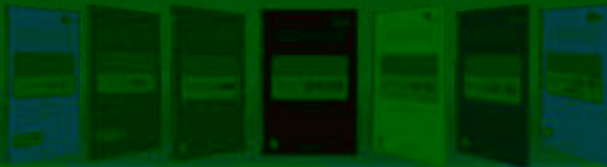
一体化课程教学设计 综合实训基地